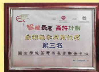
智醒長者嘉許計劃 - 最積極參與單位獎 第三名 (2013)