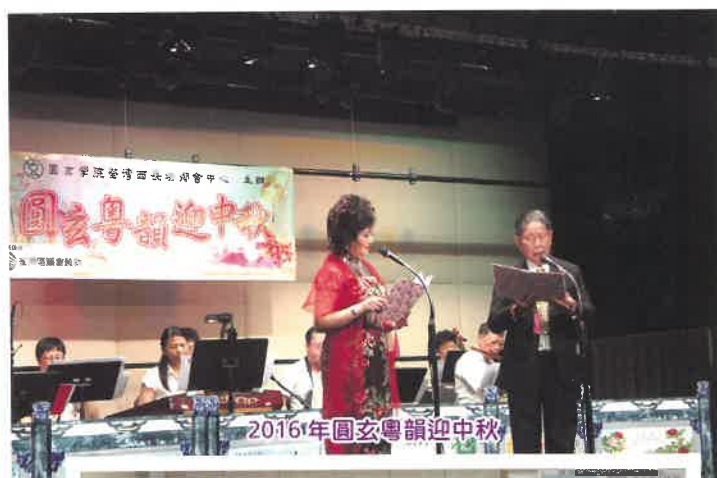
2016年圓玄粵韻迎中秋