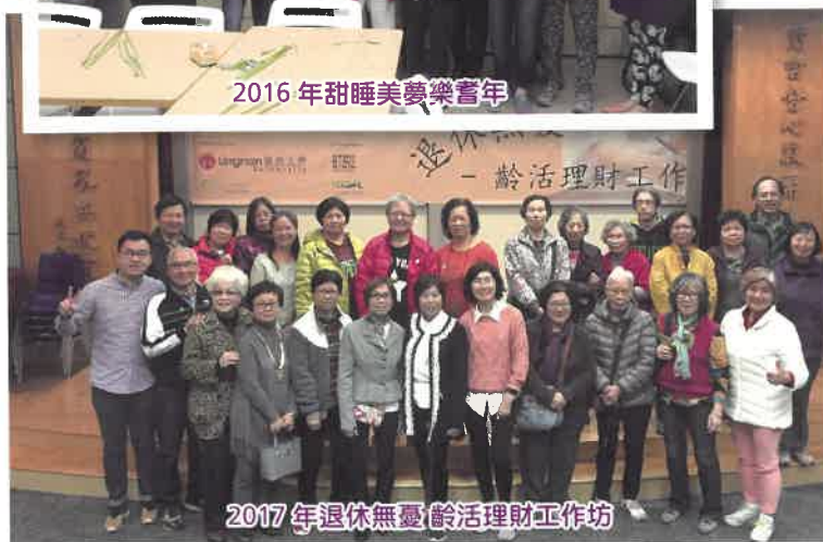
2017年退休無憂齡活理財工作坊