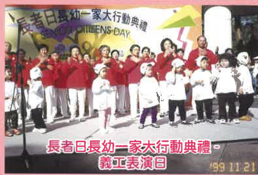
長者日長幼一家大行動典禮 - 義工表演目