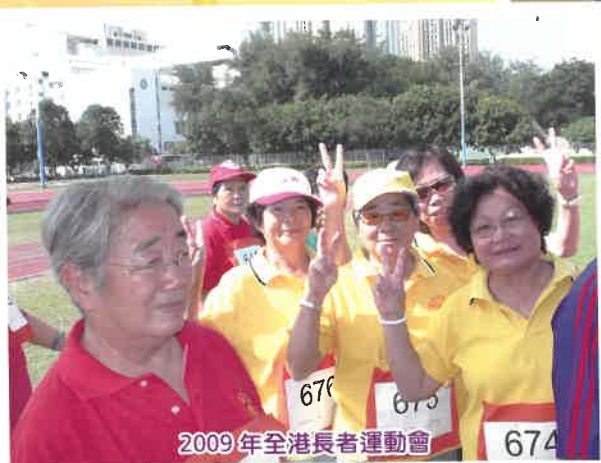
2009年全港長者運動會