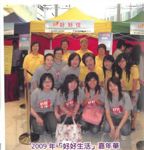
2009年「好好生活」嘉年華