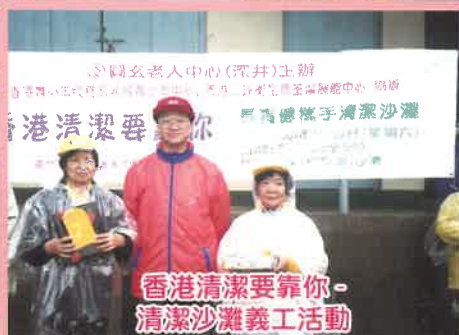
香港清潔要靠你 - 清潔沙灘義工活動