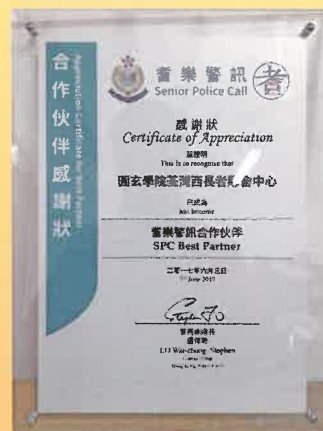
警務處耆樂警訊計劃 - 合作伙伴感謝狀 (2017)