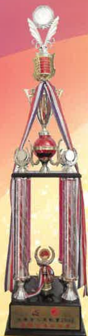
全港長者運動會 2002 團體全場總冠軍