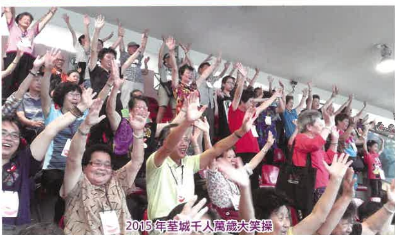
2015年荃城千人萬歲大笑操