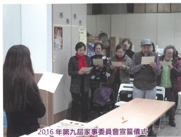
2016年第九屆家事委員會宣誓儀式