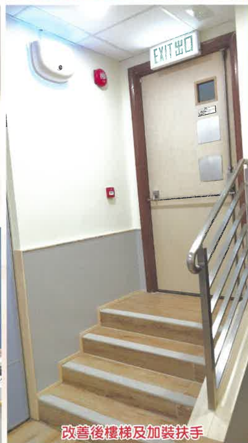
改善後樓梯及加裝扶手