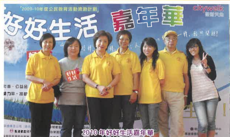
2010年好好生活嘉年華