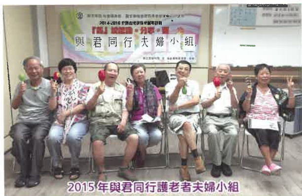
2015年與君同行護老者夫婦小組