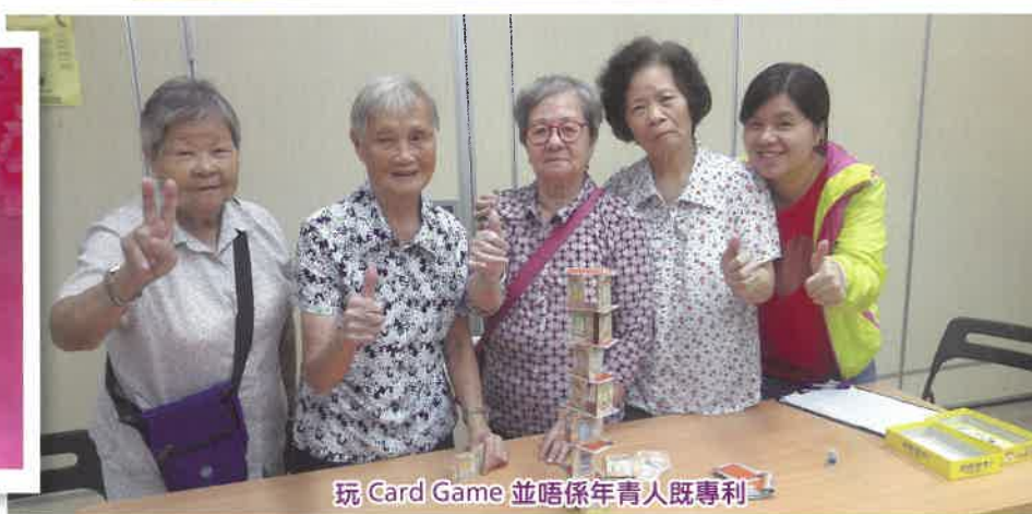
玩 Card Game 並唔係年青人既專利