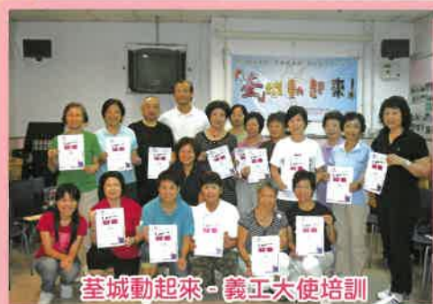
荃城動起來 - 義工大使培訓