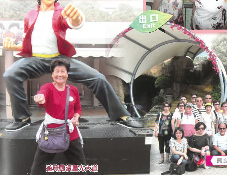
遊覽動漫星光大道