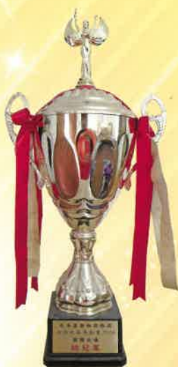
全港長者運動會 2009 團體全場總冠軍