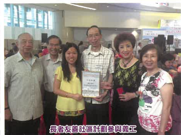
長者友善社區計劃參與義工