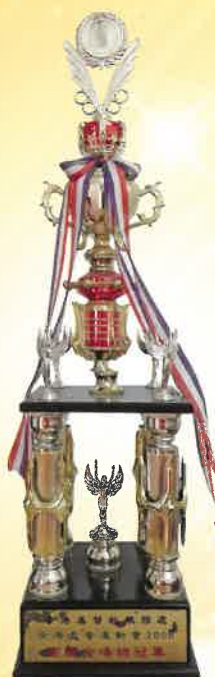
全港長者運動會 2008 團體全場總冠軍