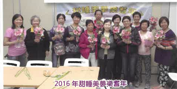
2016年甜睡美夢樂耆年