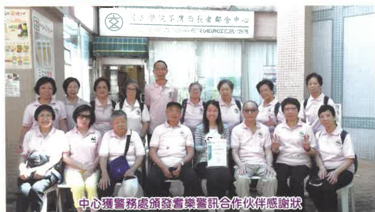
中心獲警務處頒發耆樂警訊合作伙伴感謝狀