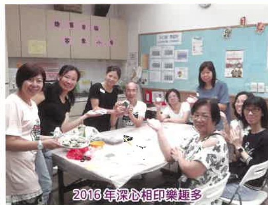
2016年深心相印樂趣多