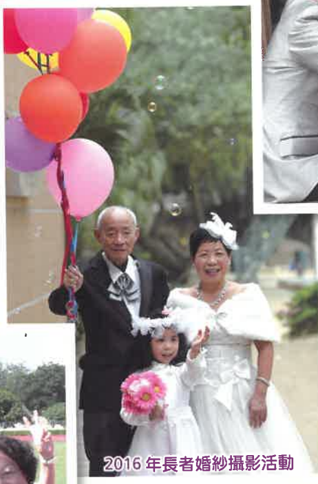
2016年長者婚紗攝影活動