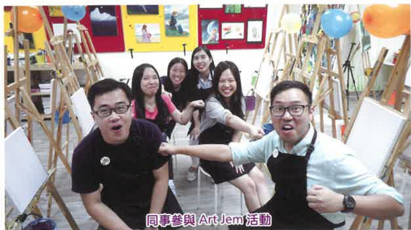
同事參與 Art Jam 活動