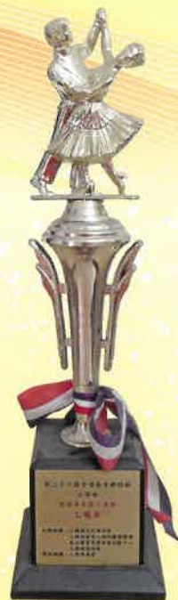
第二十六屆全港長者舞 蹈節 - 體操舞蹈或 現代舞組 - 乙級獎 (2007)