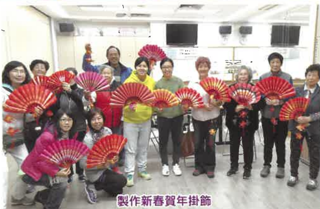
製作新春賀年掛飾