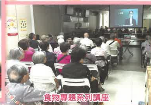
食物專題系列講座