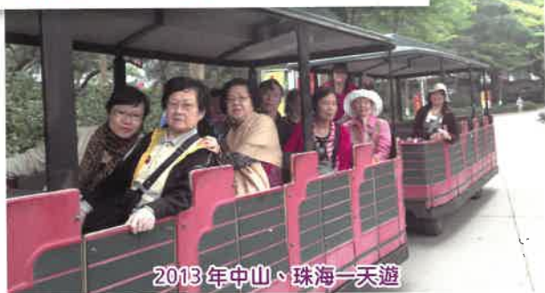
2013年中山、珠海一天遊