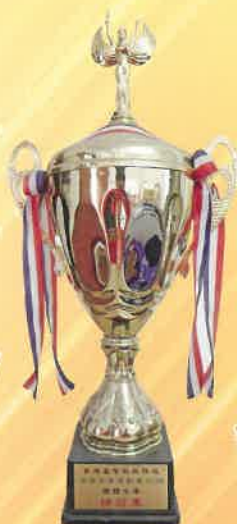
全港長者運動會 2010 團體全場總冠軍