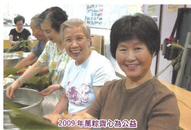
2009年萬粽齊心為公益