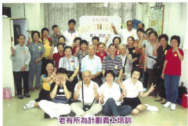
老有所為計劃義工培訓