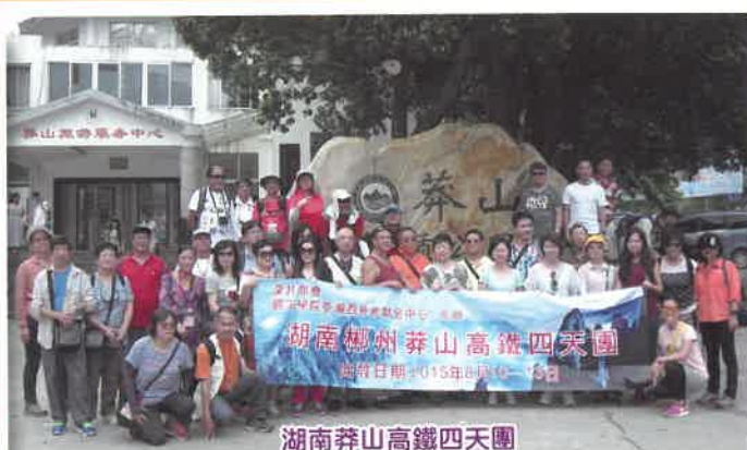
湖南莽山高鐵四天團