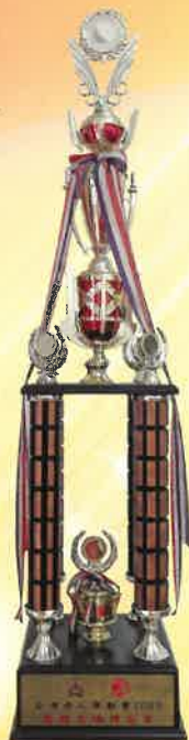
全港長者運動會 2003 團體全場總冠軍