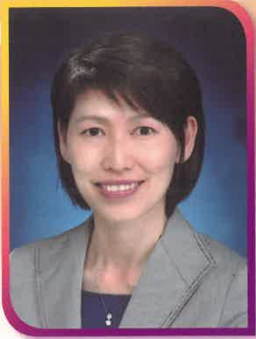
社會福利署署長葉文媚太平紳士