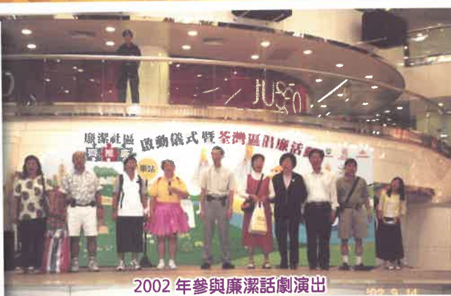
2002年參與廉潔話劇演出