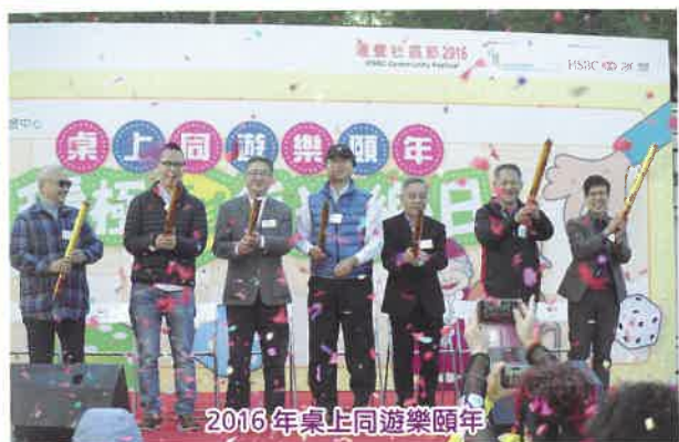
2016 年桌上同遊樂頤年