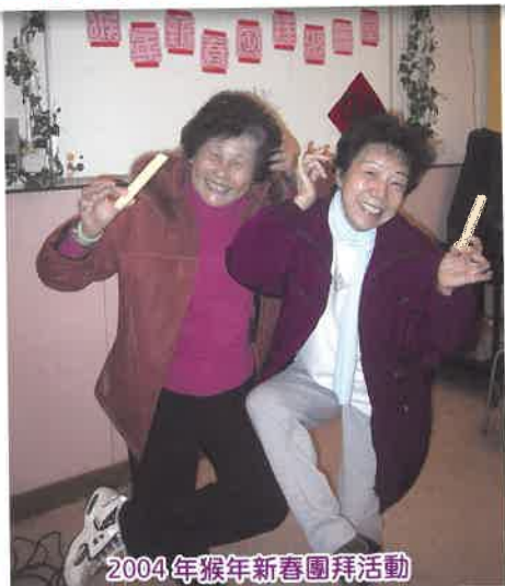
2004年猴年新春團拜活動