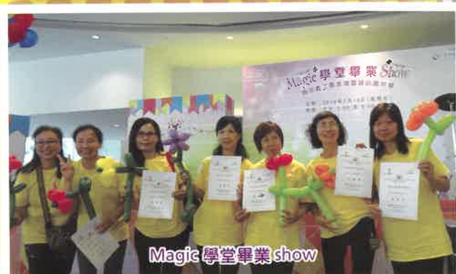
Magic 學堂畢業 show