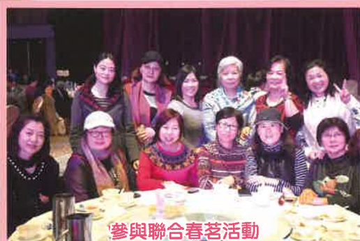
參與聯合春茗活動