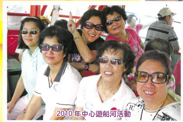
2010年中心遊船河活動