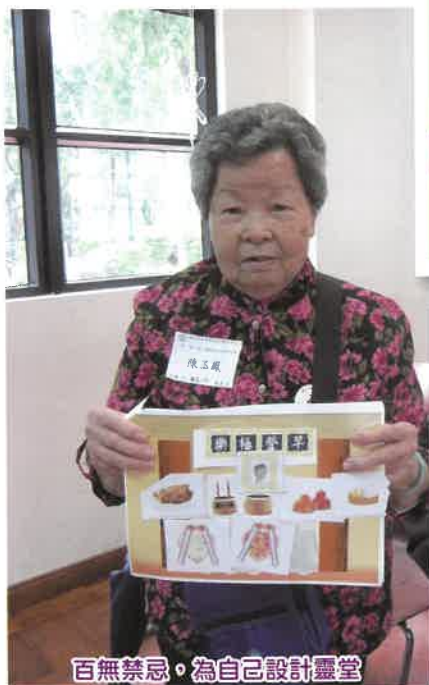
百無禁忌，為自己設計靈堂