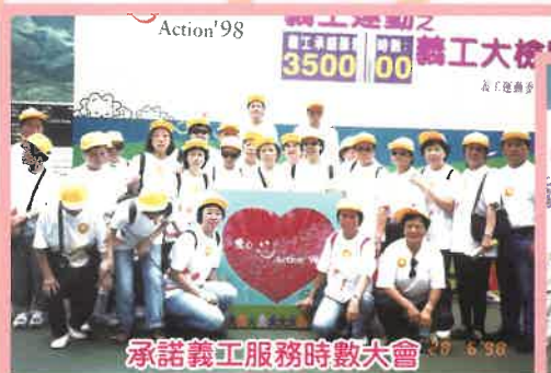
承諾義工服務時數大會