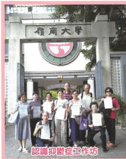
認識抑鬱症工作坊