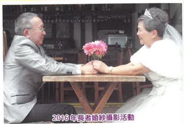
2016年長者婚紗攝影活動