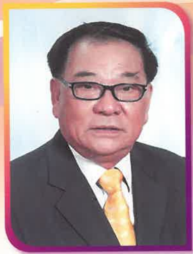
馬灣鄉事委員會主席陳崇業議員 MH