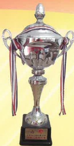
全港長者運動會 2004 團體全場總冠軍