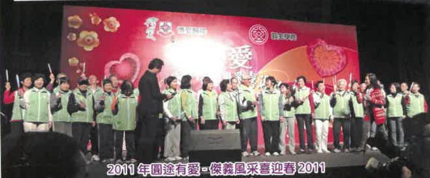
2011年圓途有愛-傑義風采喜迎春2011