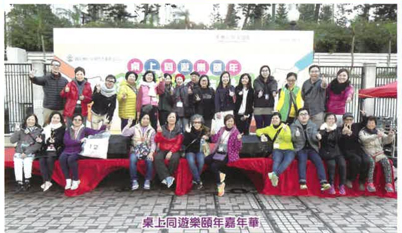
桌上同遊樂頤年嘉年華