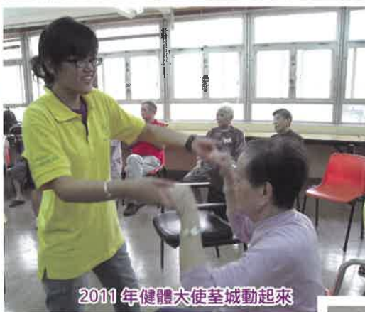
2011年健體大使荃城動起來