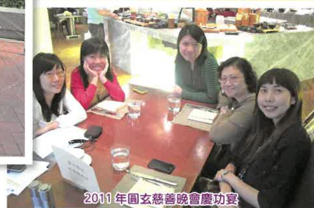
2011年國玄慈善晚會慶功宴