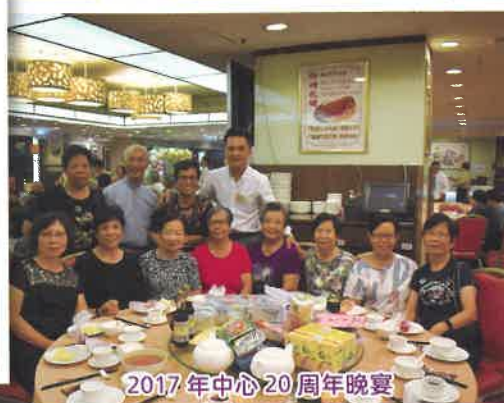
2017 年中心 20 周年晚宴