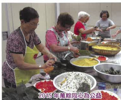
2015年萬粽同心為公益