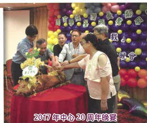
2017 年中心 20 周年晚宴