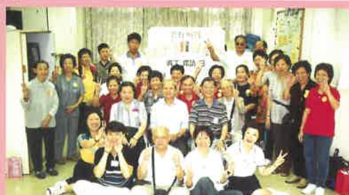
驕陽再耀萬粽情 - 派粽探訪義工活動