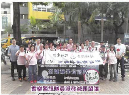
耆樂警訊隊員派發減罪單張