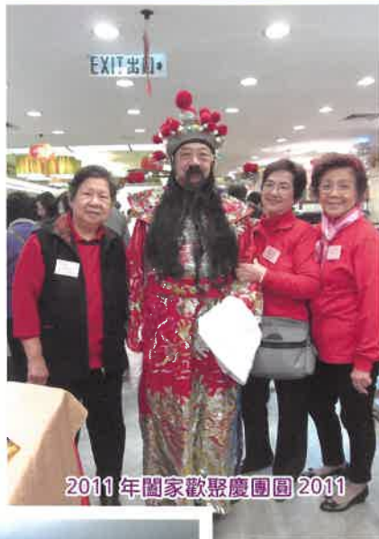
2011年閩家歡聚慶團圓2011