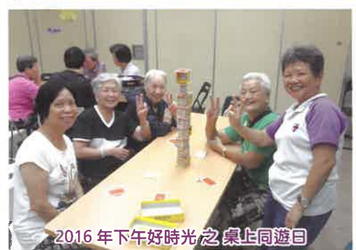
2016年下午茶時光之桌上同遊日