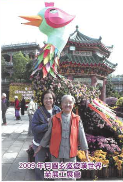
2009年月圓玄遊嘆世界-菊展工展會