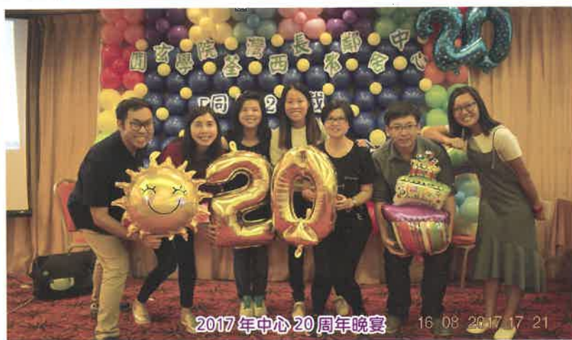
2017 年中心 20 周年晚宴