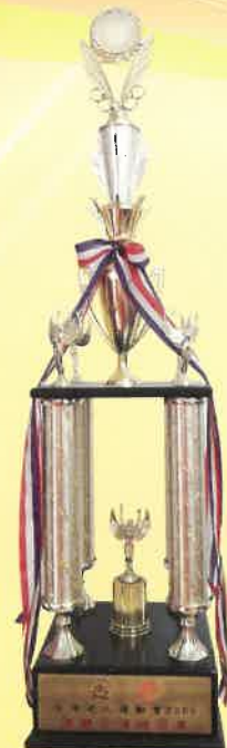
全港長者運動會 2006 團體全場總冠軍