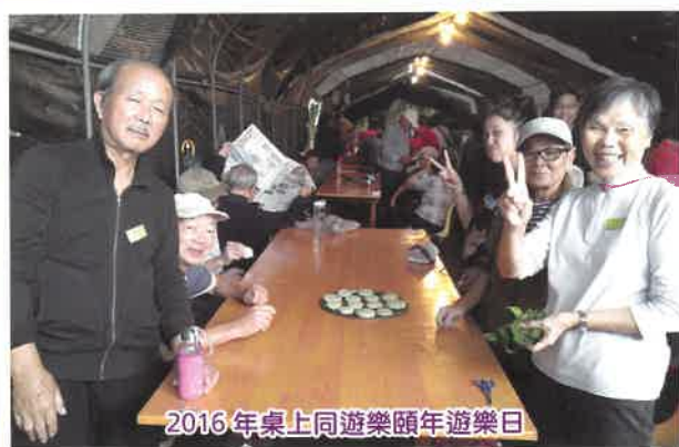
2016 年桌上同遊樂頤年遊樂日