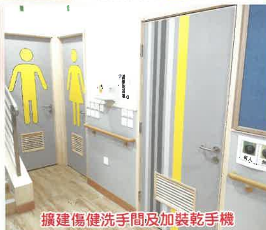
擴建傷健洗手間及加裝乾手機