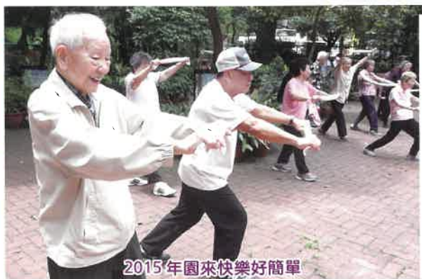
2015年園來快樂好簡單