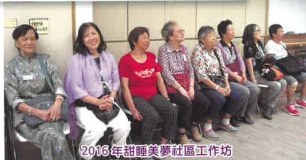
2016年甜睡美夢社區工作坊