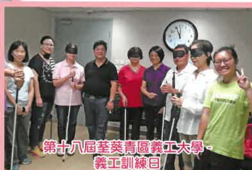
第十八屆荃葵青區義工大學 - 義工訓練日