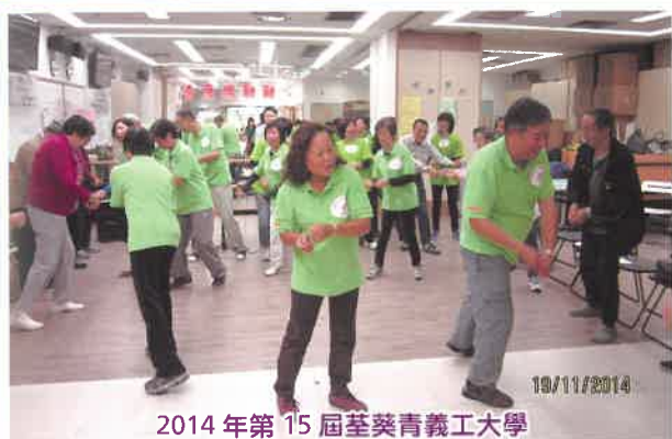
2014年第15屆荃葵青義工大學