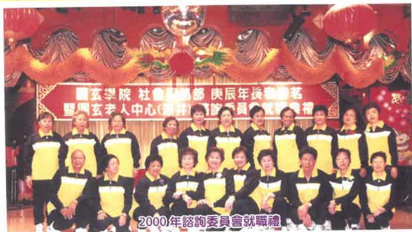
2000年諮詢委員會就職禮