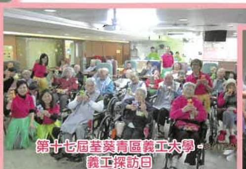
第十七屆荃葵青區義工大學 - 義工探訪日