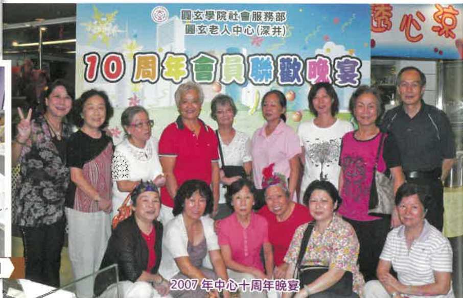
2007年中心十周年晚宴