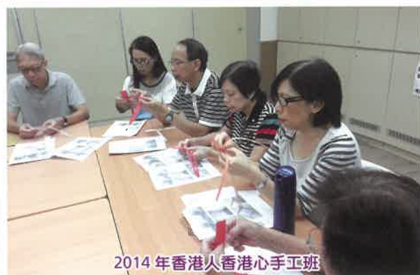
2014年香港人香港心手工班