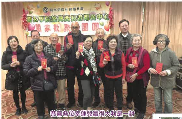
恭喜各位幸運兒贏得大利是一封