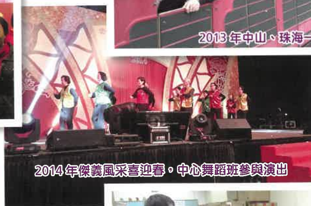
2014年傑義風采喜迎春，中心舞蹈班參與演出