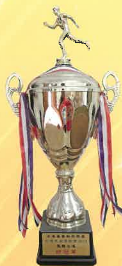
全港長者運動會 2012 團體全場總冠軍