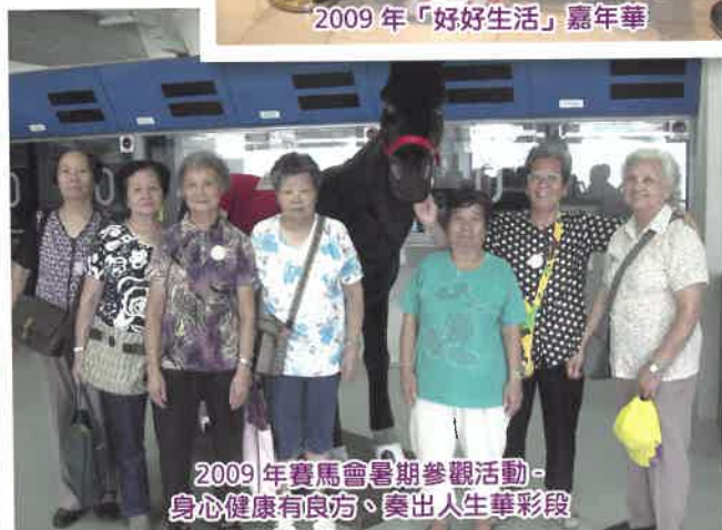
2009年賽馬會暑期參觀活動-身心健康有良方、奏出人生華彩段