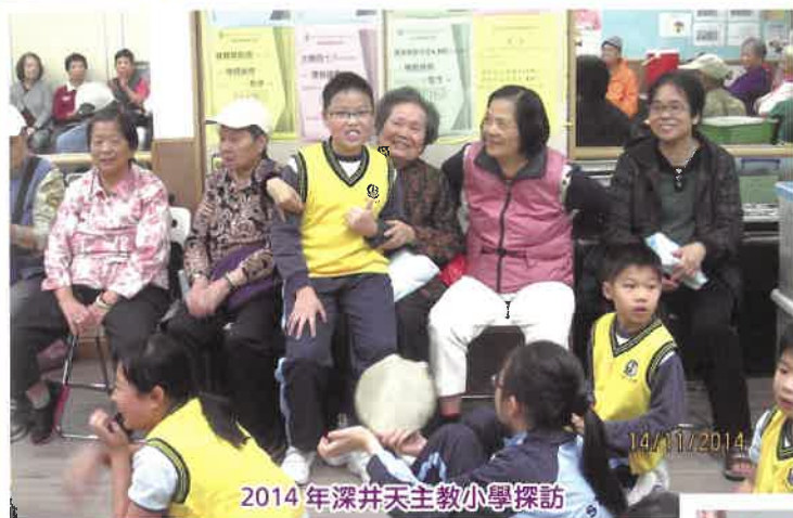
2014年深井天主教小學探訪