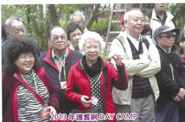
2013年護耆網 DAY CAMP