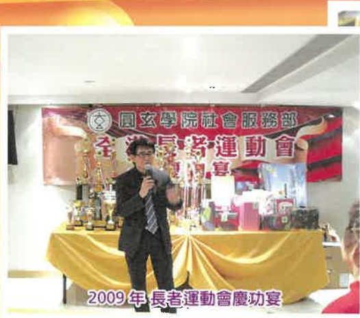
2009年長者運動會慶功宴