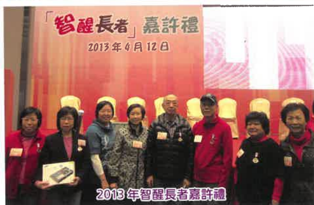
2013年智醒長者嘉許禮