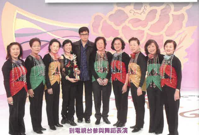
到電視台參與舞蹈表演