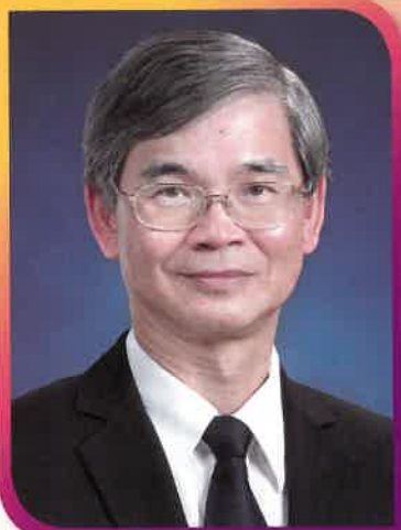
勞工及福利局局長羅致光 GBS 太平紳士