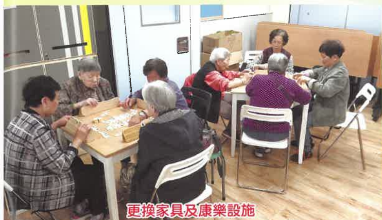
更換家具及康樂設施