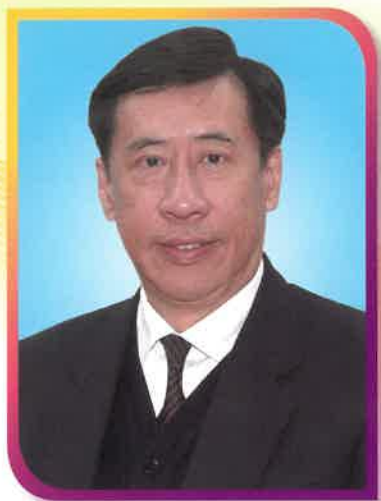
圓玄學院社會服務委員會主席