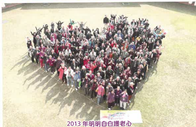
2013年明明白白護老心