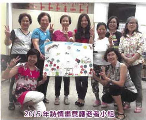
2015年詩情畫意護老者小組