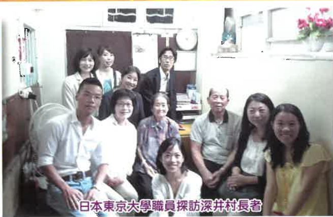
日本東京大學職員探訪深井村長者