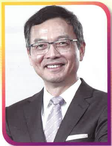
安老事務委員會主席林正財醫生 BBS 太平紳士