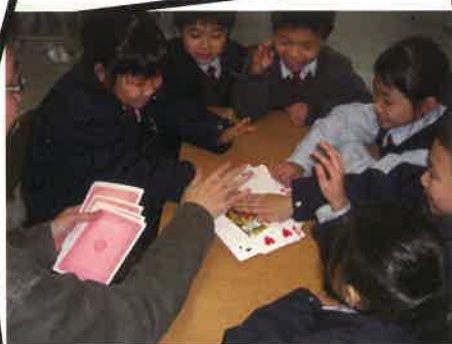
算術學習治療小組