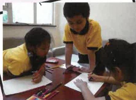
語言訓練治療小組