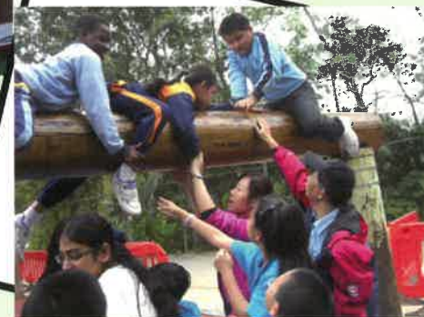
成長的天空歷奇活動